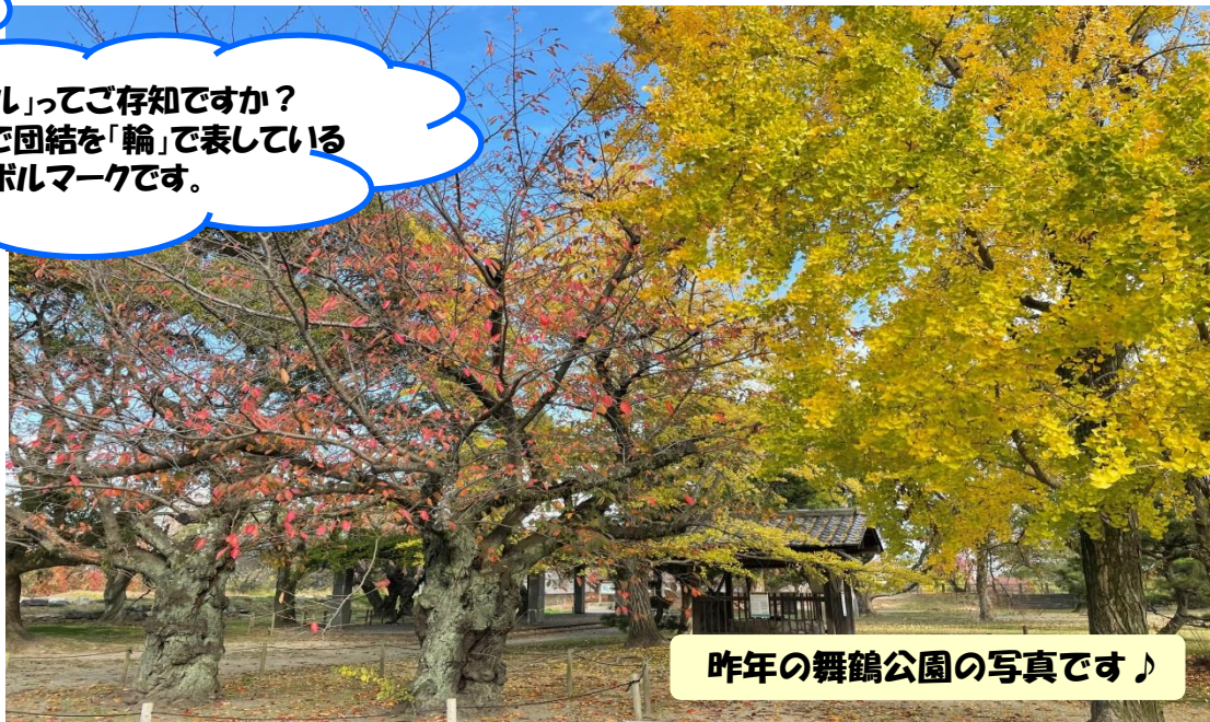
昨年の舞鶴公園の写真です♪