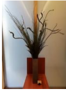
エニスタ石化・ドラセナ