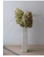
秋色ピラミッドアジサイ・コアラファン