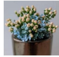
ヒペリカム・ユウカリ