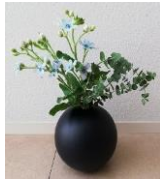
ブルースター・グニューカリ