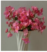
ベゴニア・ラブミー