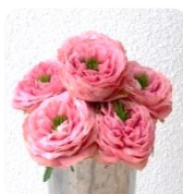
バラ・ピンクラ ナンキュラス

グループディスカッションでは“最新医療機器”や“ガールズトーク”といったグループを新しく作りました。各グループそれぞれ話が盛り上がっていたようでした。今まではこのようなイベントに来るのも嫌だったけど、勇気を出して来て良かったという声も聞かれました。同じ1型同士だからこそ共感もできて安心して頂けたようで、準備運営してきた私たちにとってもとても嬉しいお言葉でした。来年も11月頃開催予定です。まだ一度も来られた事がない方、勇気を出して参加してみませんか?【文責:受付 本高舞】