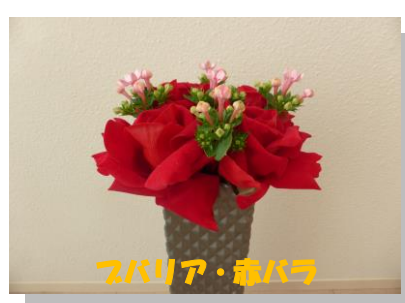
スバリア・森バラ