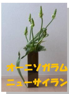
オーニソガラム・ ニューサイラン