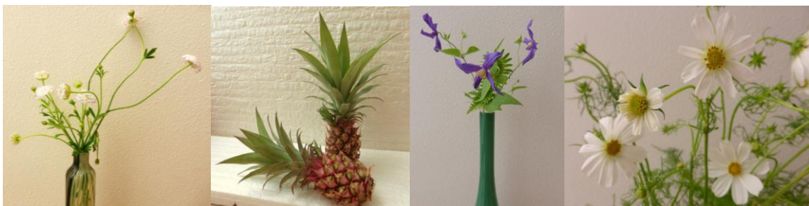
ブルーレースフラワー

当院では“診察室の前”と“受付の前”にお花を飾っています。毎週お花が変わるので、受診の際には見られないお花をこちらでお楽しみください。※毎月のお花をまとめたカードができました。ご希望の方はお声かけください。