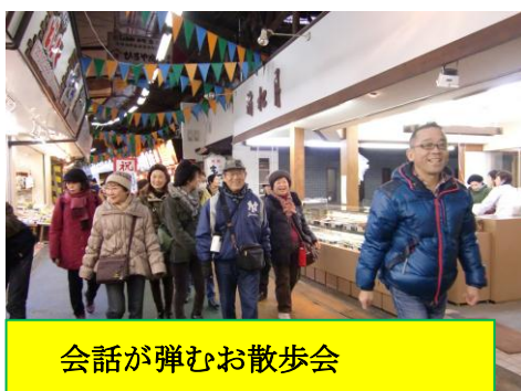
会話が弾むお散歩会

今後、皆さんそれぞれの特技を活かした教室開催など企画に上がっています。役員希望でなくとも、ぜひ我こそはこんな特技を持っているぞという頼もしい方も、ご協力いただける場合はスタッフまで声をかけてくださいね。