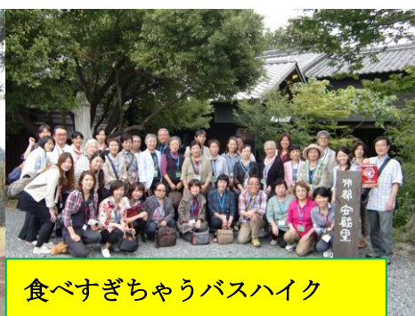
食べすぎちゃうバスハイク