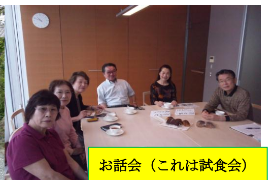
お話会（これは試食会）